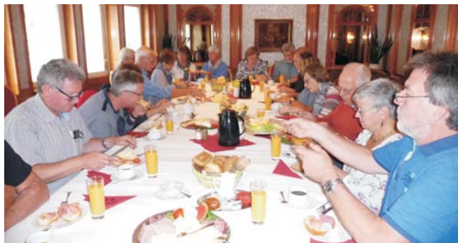
Frühstück im Barock-Café Anders in Goslar.

Sehr pünktlich waren alle Teilnehmer zum Abfahrtsort Adolf-Grimme-Schule gekommen, und dadurch waren wir startklar zu unserer Tages-/Schulungsfahrt in den Nordharz zum Besuch der drei mittelalterlichen Städte Goslar, Wernigerode und Quedlinburg. In der Welterbestadt Goslar angekommen, ging es schnurstracks zum Barock-Café Anders, wo ein opulentes Frühstück auf die Reisegruppe wartete. Bei der anschließenden Führung in der Goslarer Kaiserpfalz gab es manch erstauntes Gesicht über die dort erhaltenen Schätze. Die Gästeführerin brachte den Reiseteilnehmern die